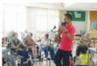
「さあ、みんなでカチャーシー」