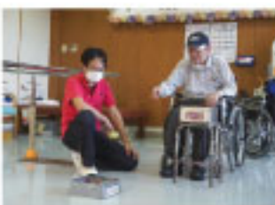
「箱に命中！！」 手の感覚を高めます