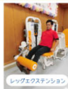
レッグエクステンション