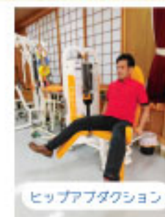
ヒップアブダクション