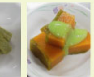
かぼちゃの煮つけ