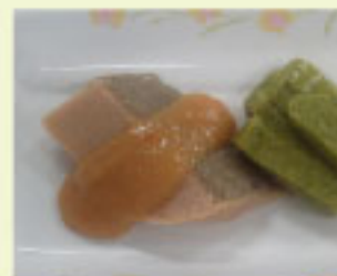
鮭のほうれん草添え