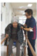
「よんなー歩こうねっ」