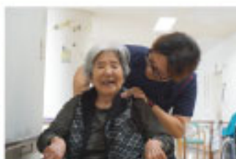
頸部・肩関節をストレッチ！ (実のおばあちゃんと演ずる)