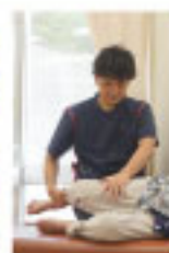
硬い筋肉をほぐします！